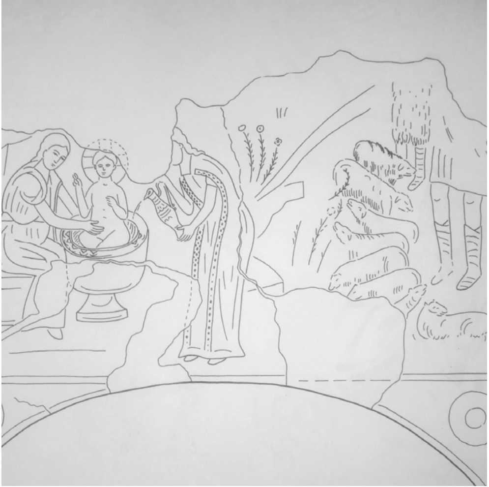
Композиција Христовог рођења на северном поткуполном делу храма Вазнесења Господњег манастира Милешеве – детаљ који показује фрагментарну представу пастира 51

је да су Турци у новембру 1459. године пљачкали и спалили Милешеву. 48 Четири године касније (1463) записано је у истом летопису да су Османије поразиле војску херцега Стјепана Вукчића Косаче на реци Брезници, притоци Техотине. 49 Милешевко властелинство, и Власи на њему, морали су осетити последице поменутих турских напада на херцегове земље, окончаних најкасније 1465. године. 50