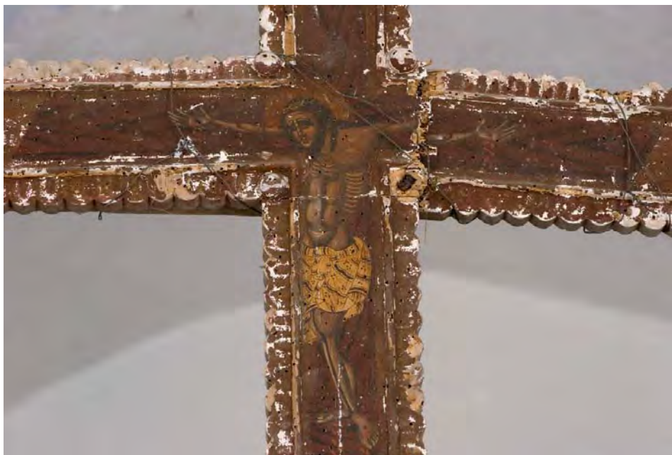
Сл. 5. Распеће (1751), иконостас Цркве светог Ђорђа у Радованићима (Луицица)