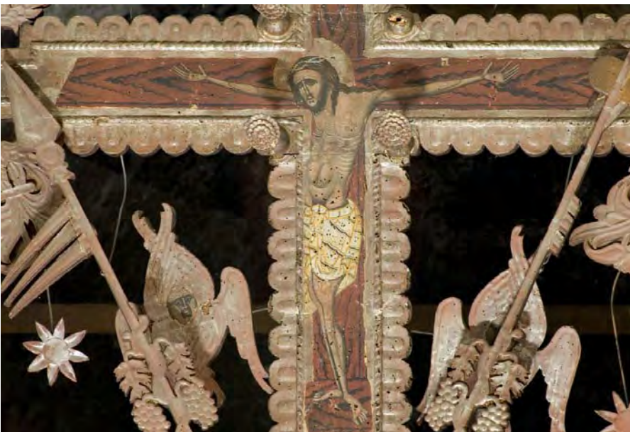
Сл. 4. Распеће (око пол. XVIII века), иконостас Мале цркве манастира Савина