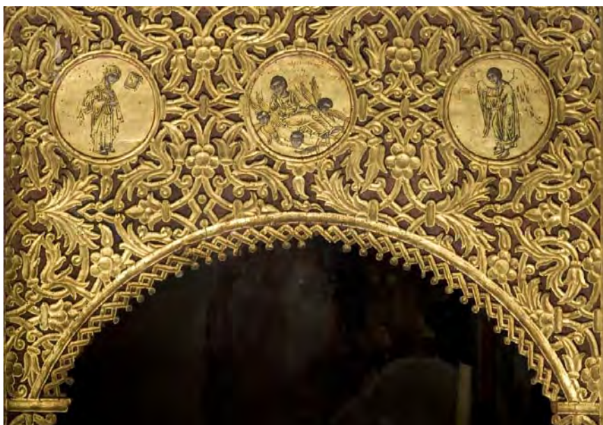
Сл. 2. Северно надверје (око пол. XVIII века), иконостас Мале цркве манастира Савина