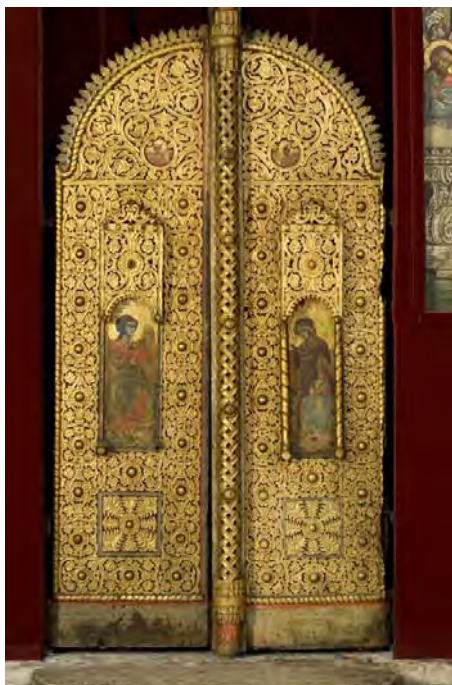
Сл. 1. Царске двери (1703), иконостас Мале цркве манастира Савина