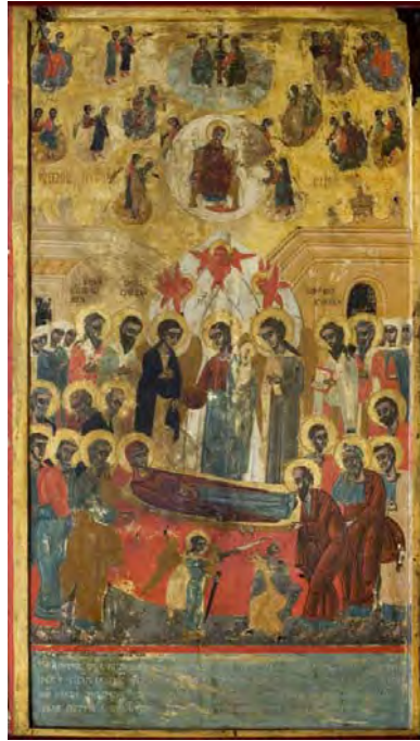
Сл. 3 Престона икона Успења Богородичиног (1756), иконостас Мале цркве манастира Савина